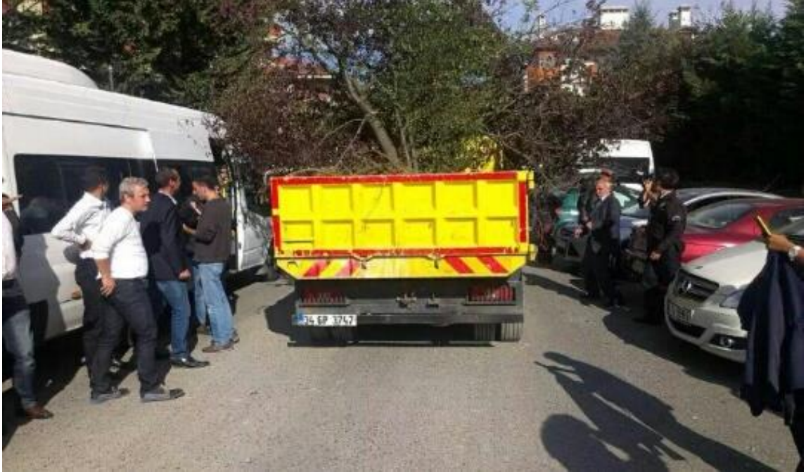
Ağaçlar alandan sökülüp götürülürken.