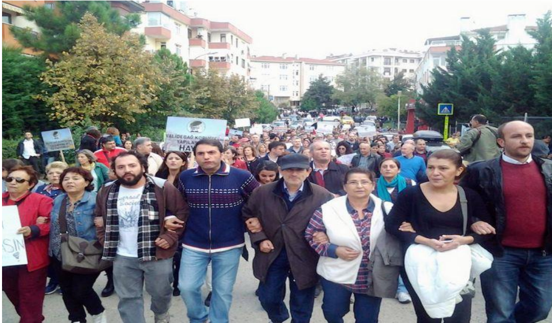
Protestolar esnasında.