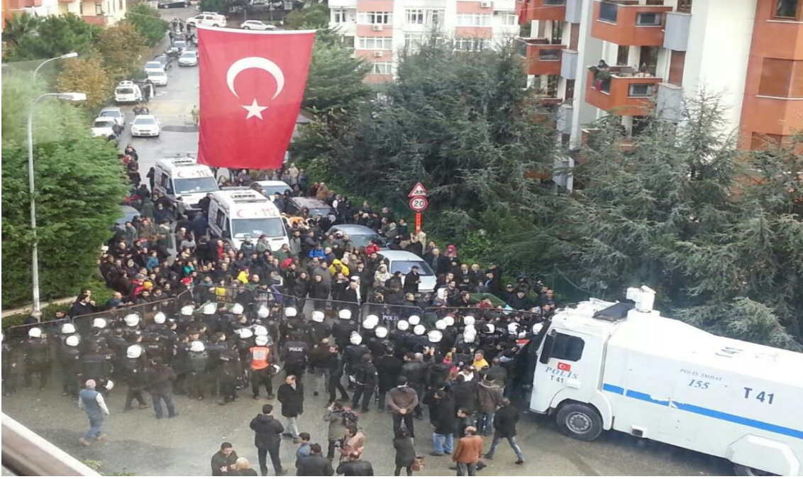
Direnış alanı: Prostestocular ve polisler.