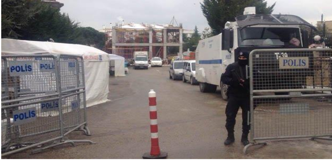
Cami inşaatı devam ederken, inşaatın önü.