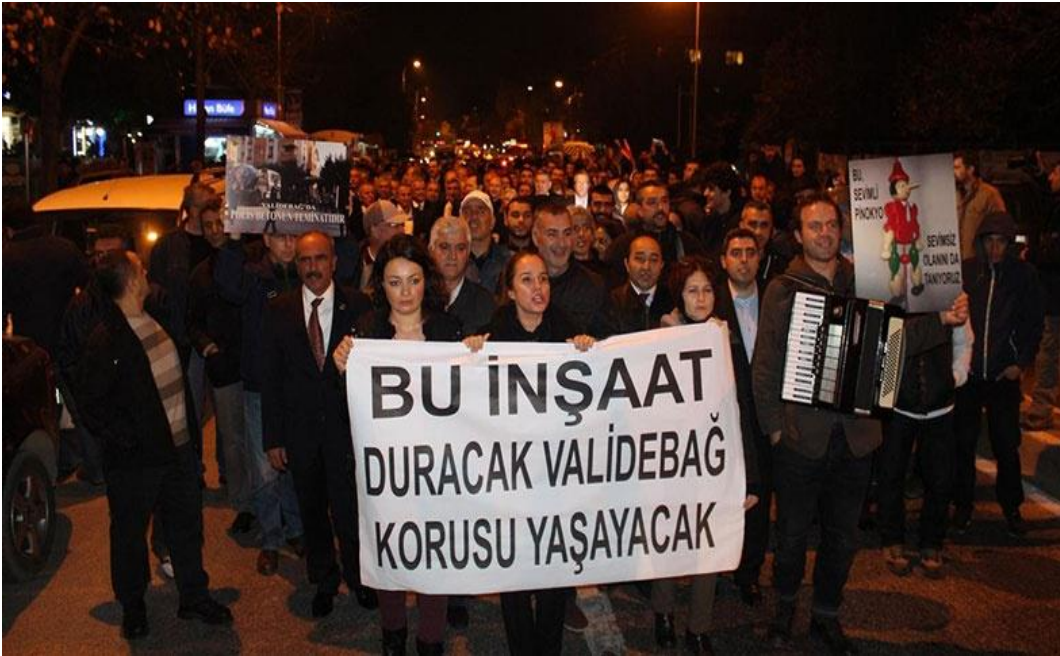
Cami inşaatına karşı bölgede gece gerçekleşen protesto. Kaynak: Aljazeera (2014). Validebağ İçin Yürüdüler.